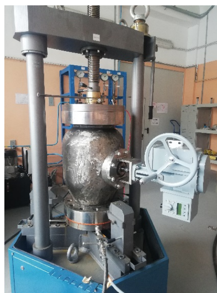
Приемочные испытания опытных образцов

Область применения: все объекты, участвующие в освоение шельфовых месторождений, предприятия машиностроения.